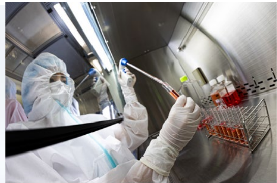
図1：装着型サイボーグ HAL®自立支援用下肢タイプ Pro 図2：スマートクリニック東京で使用するヒト乳歯由来歯髄幹細胞培養上清液